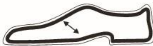
Vooder ja sisetald